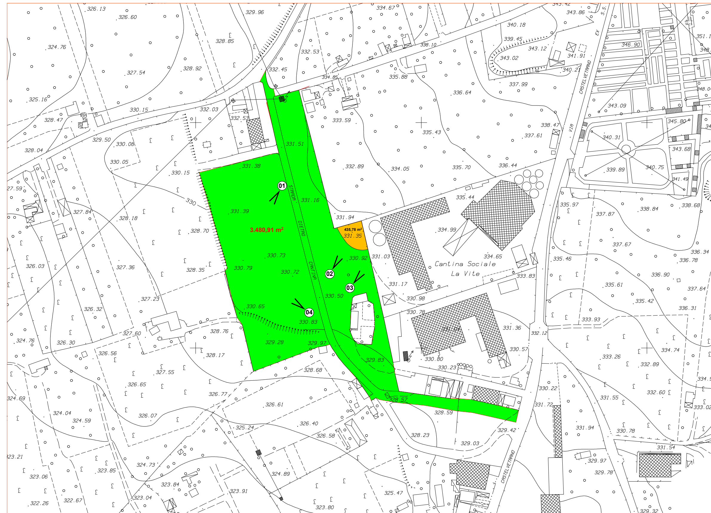
AEROFOTOGAMMETRIA EX BARACCOPLI "DIETRO CANTINA" Scala 1:200